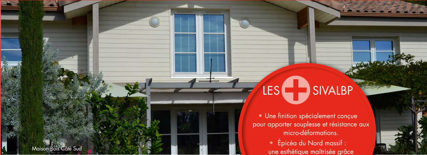
Maison Bois Côté Sud