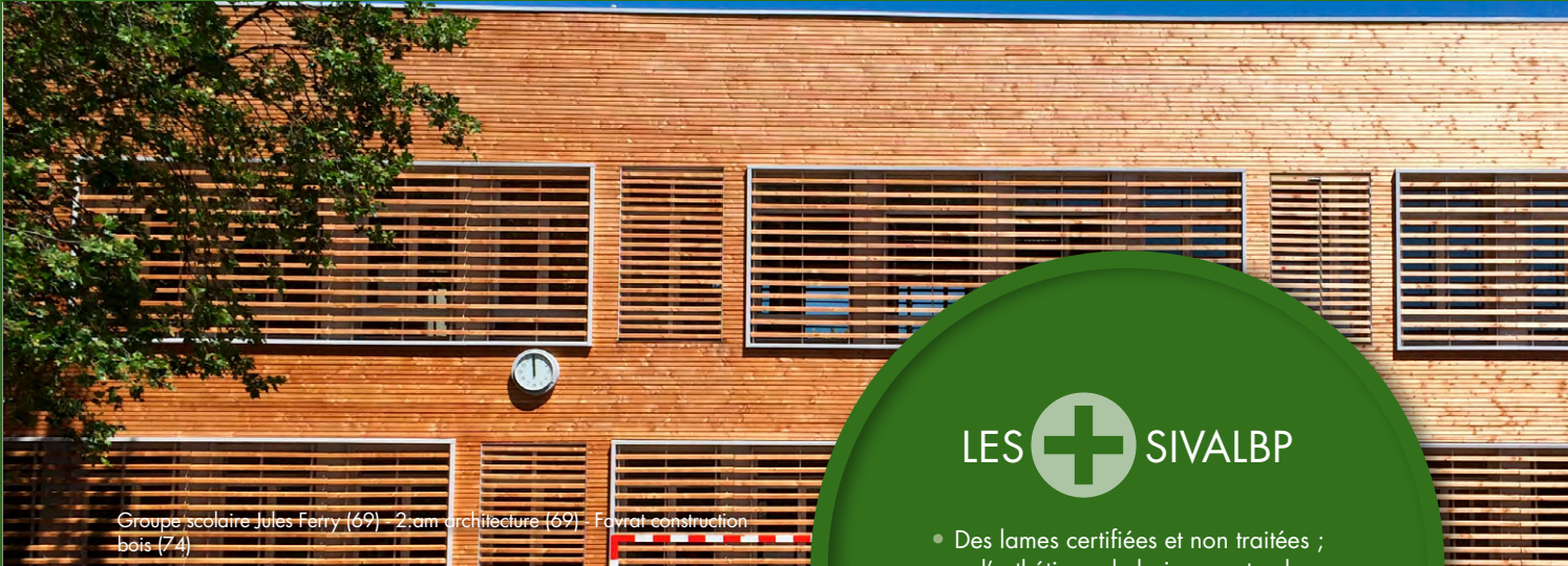
Groupe scolaire Jules Ferry (69) - 2.am architecture (69) - Favrat construction bois (74)