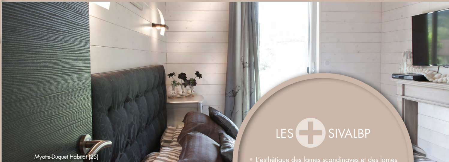
Myotte-Duquet Habitat (25)