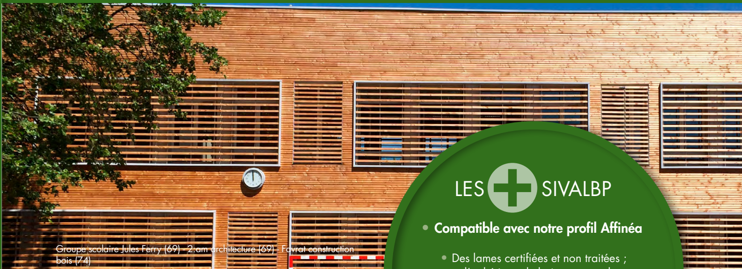
Groupe scolaire Jules Ferry (69) - 2.am architecture (69) - Favrat construction bois (74)