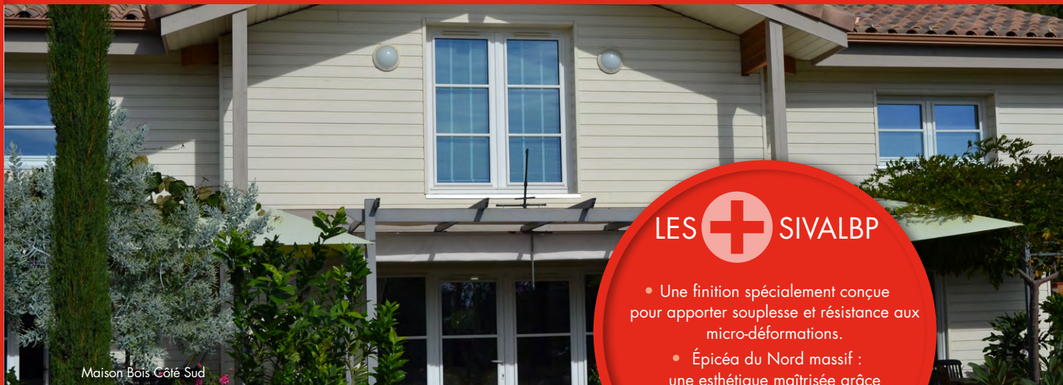
Maison Bois Côté Sud